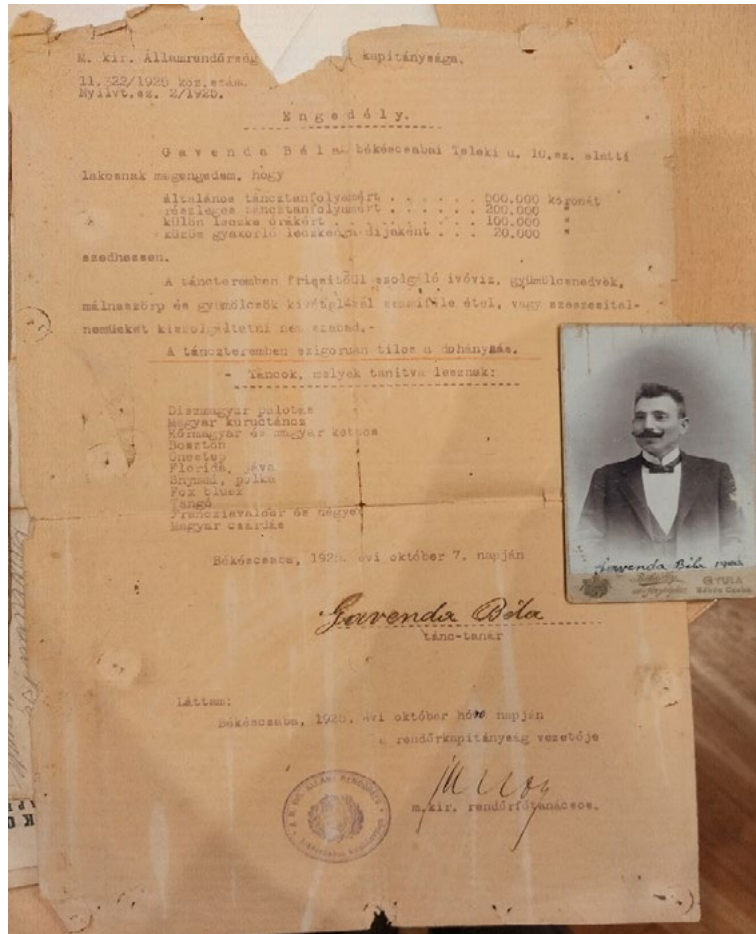
8. kép: A táncmester hivatalos engedélye 1925-ből.

kereste a falu lakosságának kollektív emlékezetében található tartalmakat. Maurice Halbwachs szerint a múlt rekonstruálása a személyes emlékekhez való kötöttségünket is megjeleníti. A múlt rekonstruálásával kapcsolatban hajlamosak vagyunk a hitelesség érdekében emlékeinket helyesbíteni és kiegészíteni, személyekhez és megélt tartalomhoz kapcsolni, ami által az időbeli távolság az átélt valóságnak tekintélyt kölcsönöz. 22 A szellemi folklorikincs ezért az interjúalanyok közlésében egyéni színezetet kaphat, ami eltérhet a valóságtól vagy szubjektív tartalmat közölhet. Kaposi Edit gyűjtésében teljesen egyértelmű módon azokat az ikonikus, szinte mitologikus alakokká váló személyeket-alakokat mutatta meg, amelyek az 1848-as szabadságharchoz hozzátartoznak. Ezek Kossuth Lajos, Bem József, Klapka György vagy Görgey Artúr alakjai. Ezeken