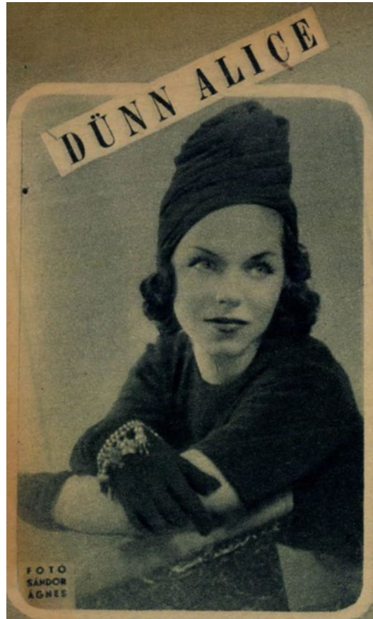
Dünn Alice Film Színház Irodalom 1942_14

fogva alakították, formálták a mindennapok divatját. Mivel a szalonok modelljeiről a képes magazinok rendszeres tudósításokat közöltek, így tevékenységük az elit reprezentációján keresztül jelentős befolyással bírt a kollektív reprezentációra. Egy-egy divatszalon működésének, valamint tulajdonosának társadalomtörténeti megközelítésével, az egyéni sorson keresztül annak a társadalmi csoportnak jellemzői is leírhatók, amelyhez az egyén tartozik (Gyáni 1997).