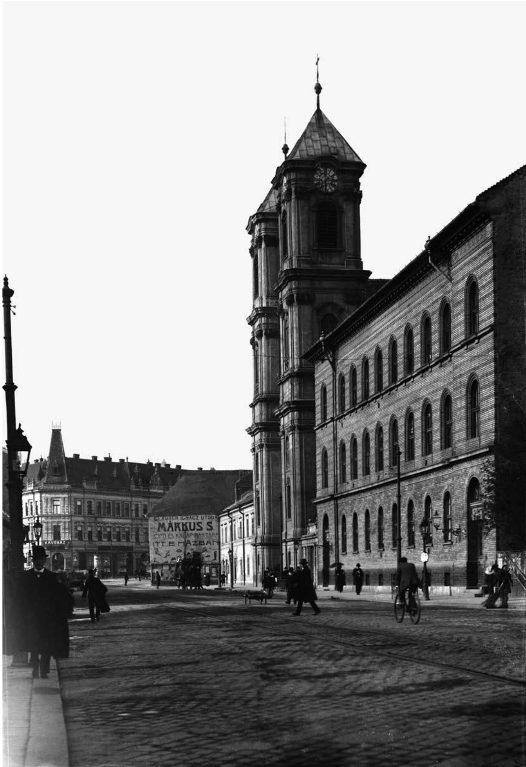
Kapisztrán rendi templom, Országúti ferences templom (1909)