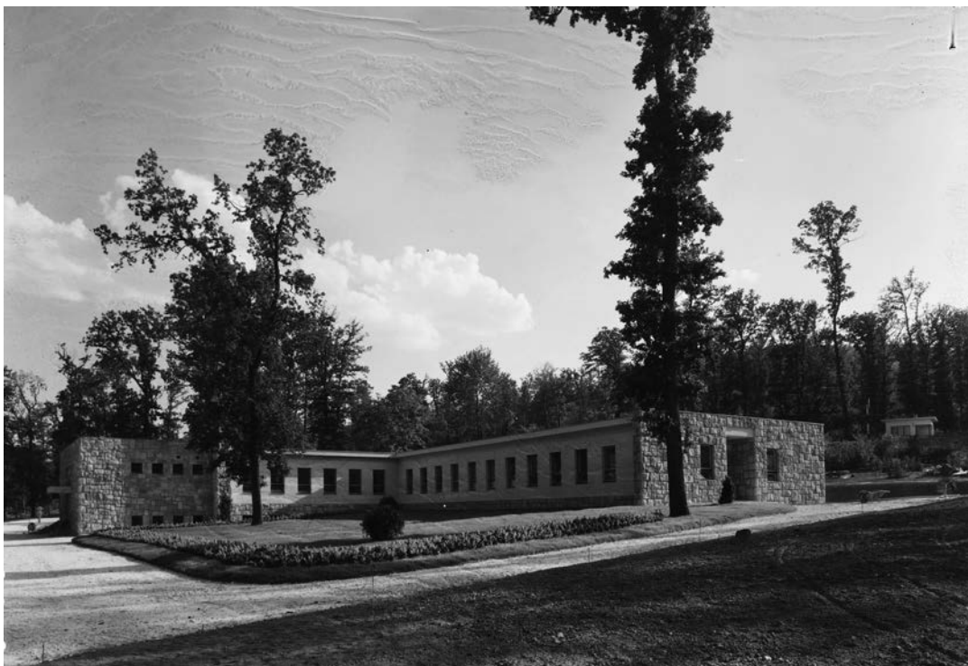
Üzemfőnökségi épület a Gyermekvasút (Úttörővasút) végállomásánál. (1950)