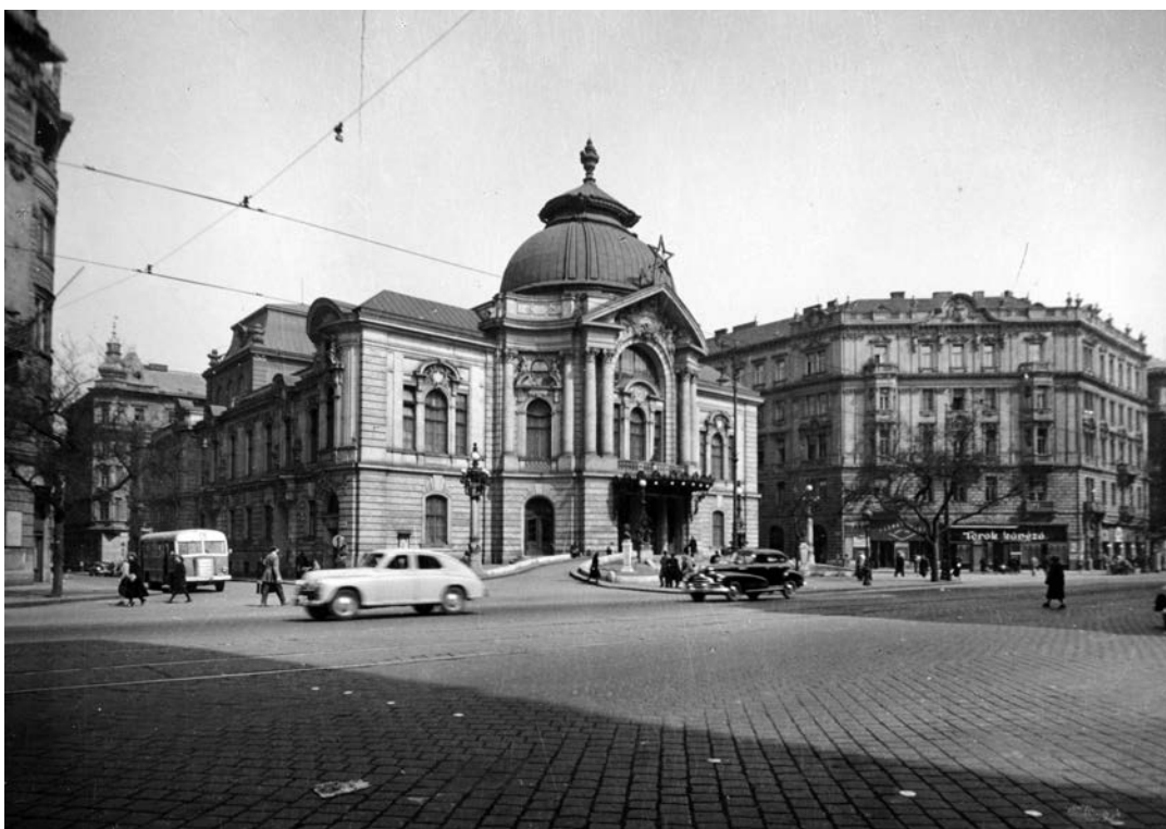
Szent István körút, Vigaszínház. (1954)

Az ötvenedik születésnapon – az előzmények ismeretében – szellemi összefogást és további sikeres lapszerkesztést kívánok a Kultúra és Közösség Szerkesztőségének és Szerzőinek!