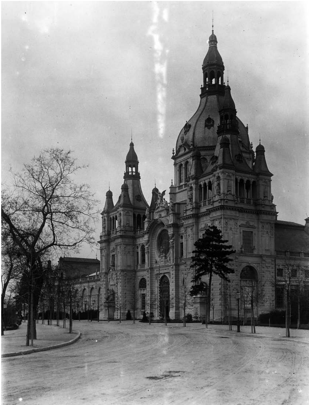
A millenniumi kiállításra épített Közlekedési csarnok. (1900)