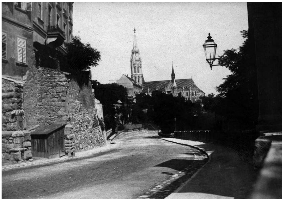
Budapest. Hunyadi János (Főherceg Albrecht) út, balra a budai Vár keleti támfala. Háttérben a Mátyás-templom (1900)