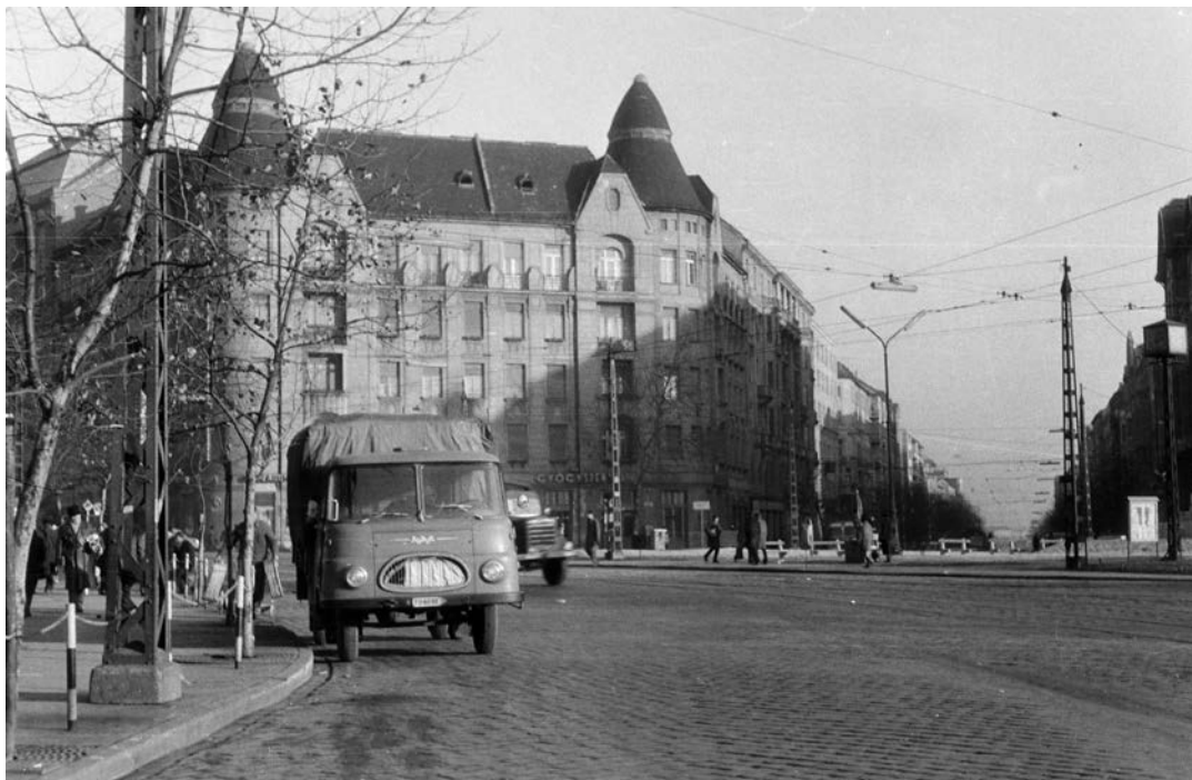
Budapest. Móricz Zsigmond körtér, szemben a Karinty Frigyes út. (1963)

Virilio, Paul – Lotringer, Sylvère 1993. Tiszta háború. Tartóshullám, Balassi, Budapest.