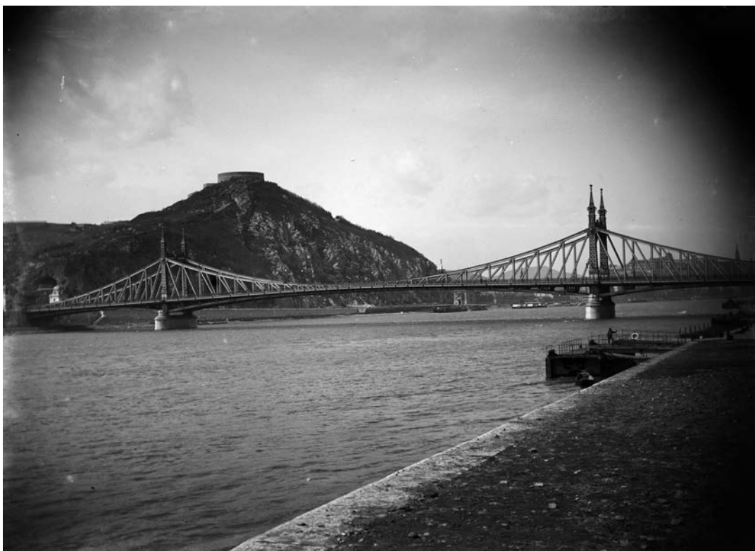
Fortepan / Plohn József Budapest. A Szabadság (Ferenc József) híd és a Gellért-hegy a pesti alsó rakpartról nézve. (1900)

A ’köz’ előtaggal kezdődő szavaink és tevékenységeink nemcsak a magyar nyelvben, de a társadalmunkban is jelentős helyet, sőt meghatározó szerepeket töltek be. „Az enyim , a tied mennyi lármát szüle, Miolta a miénk nevezet elüle” – írta Csokonai Vitéz Mihály az 1790-es években „Az estve” című versében. Talán nem járunk messze az igazságtól, amikor azt mondjuk, hogy történelmünk során, hazánk állapotának, társadalmunk fejlődésének és jövőbeli létezésének mindig „lakmusz papírijai” voltak/lesznek a ’köz’ előtaggal kezdődő kifejezések, tettek és közösségek...”