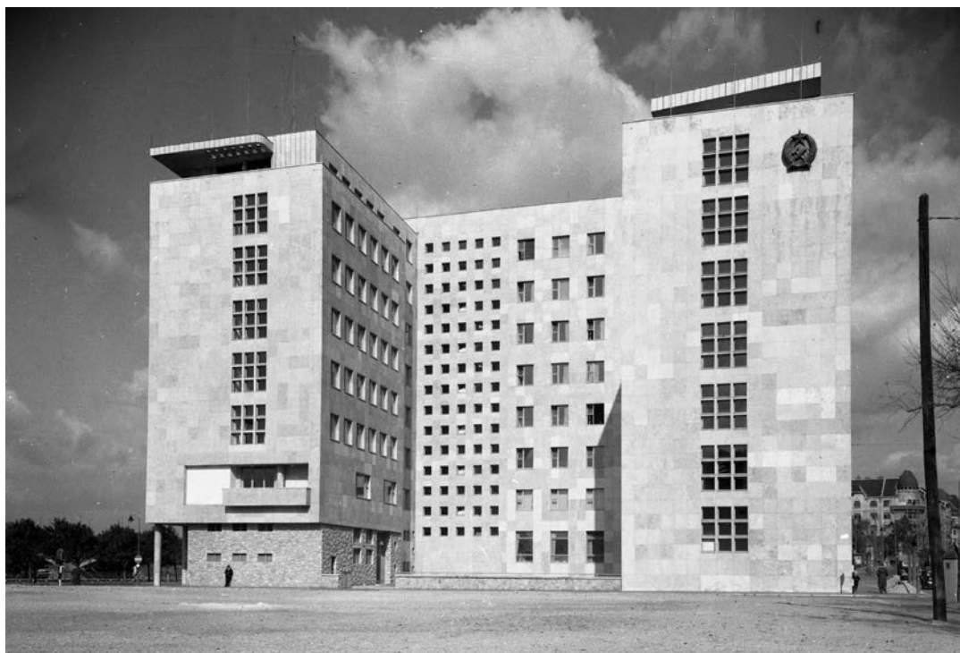
Budapest. Olimpia park (Stollár Béla utca), a Belügyminisztérium épülete, a mai Képviselői Irodaház ("Fehér Ház"). (1950)