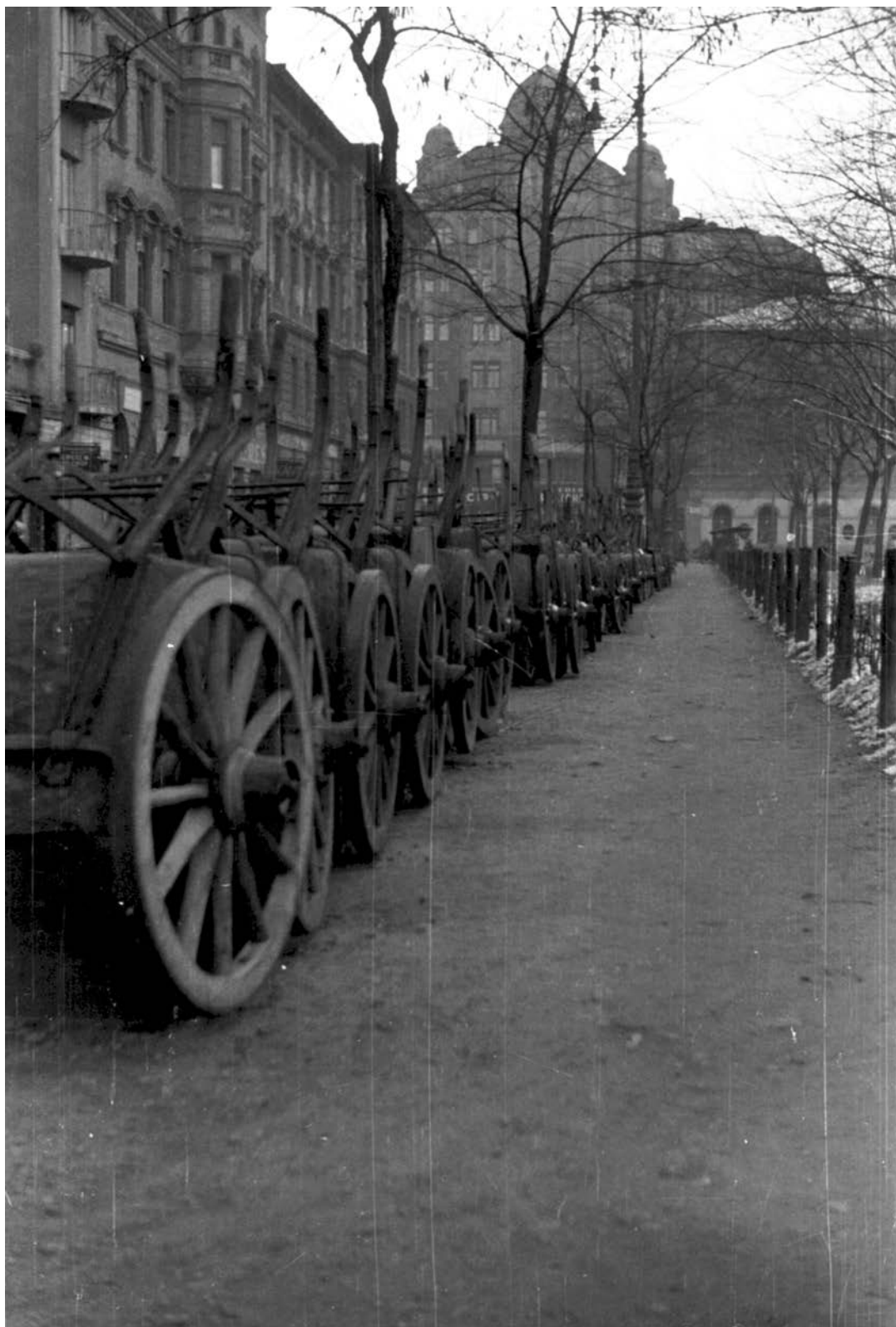
Budapest. A II. János Pál pápa (Tisza Kálmán) tér déli oldala a Népszínház utca felé nézve. (1943)