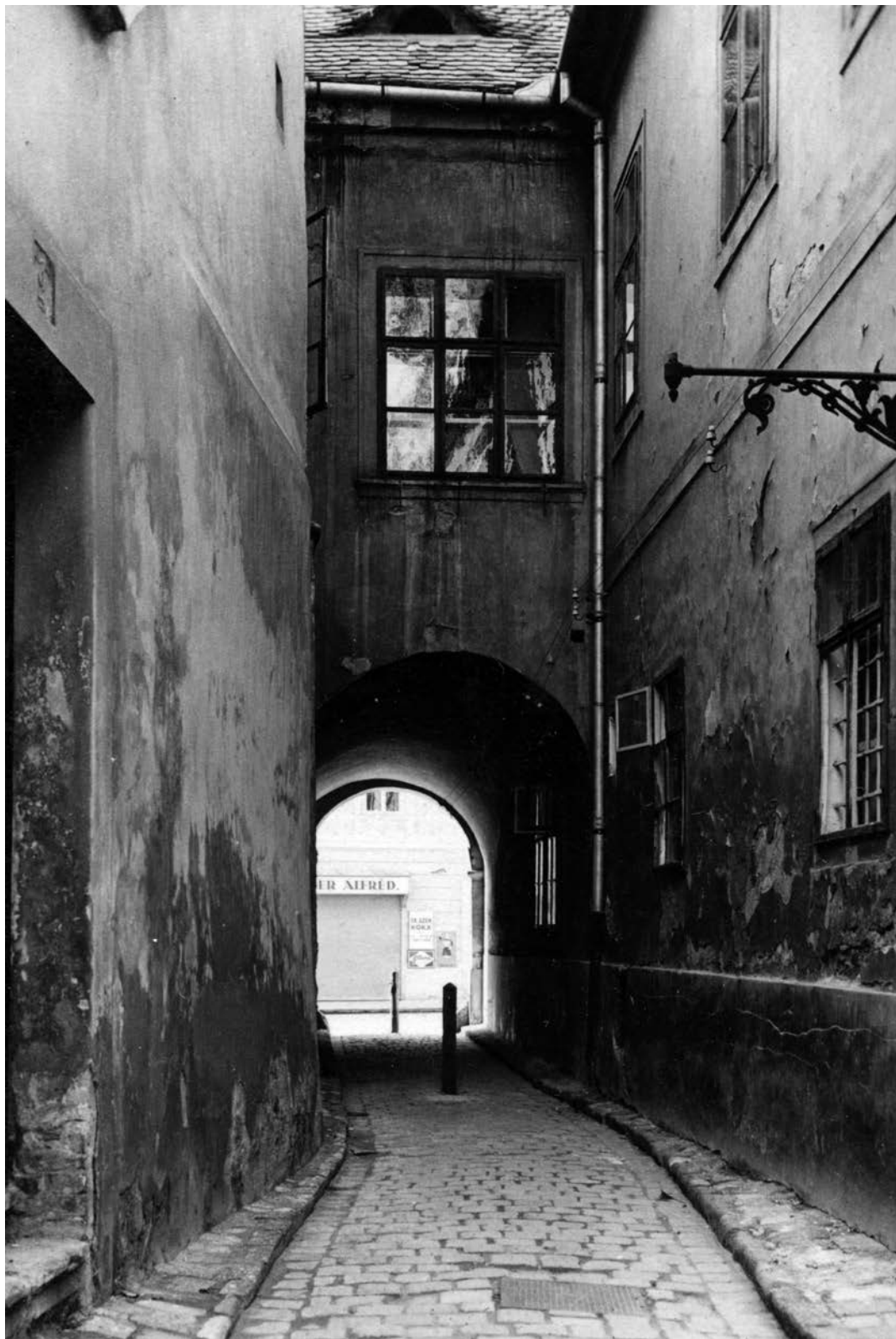
Budapest. Balta köz az Úri utca felé nézve. (1926)