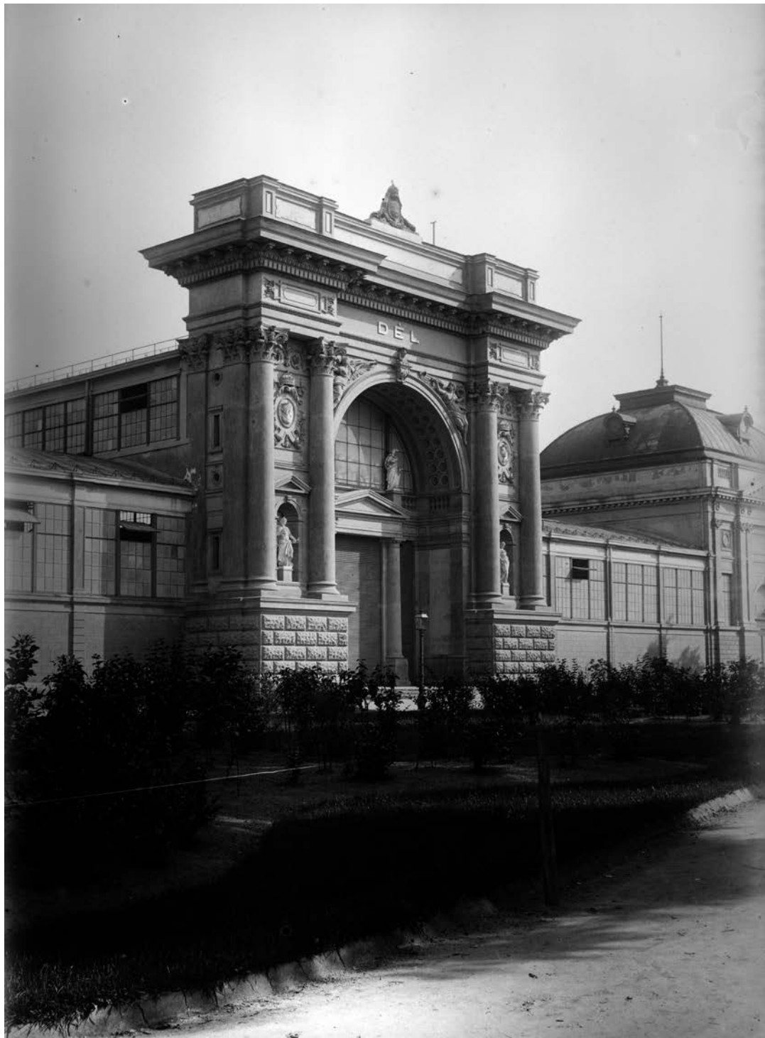
Iparcsarnok. (1900)