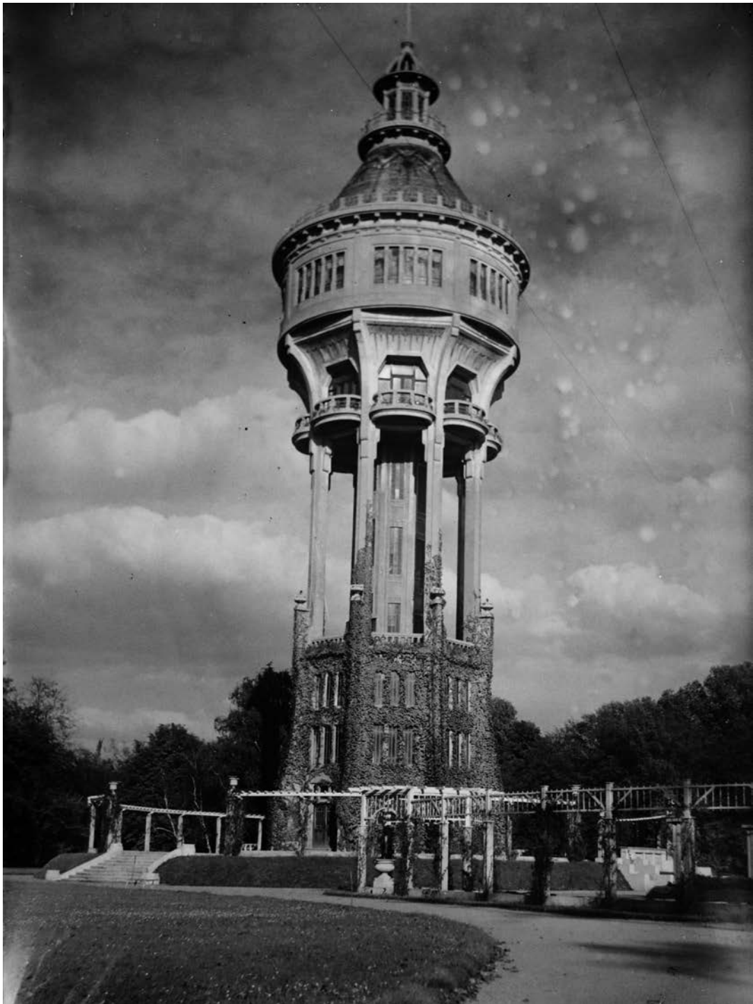
Budapest. Margitsziget. (1940)