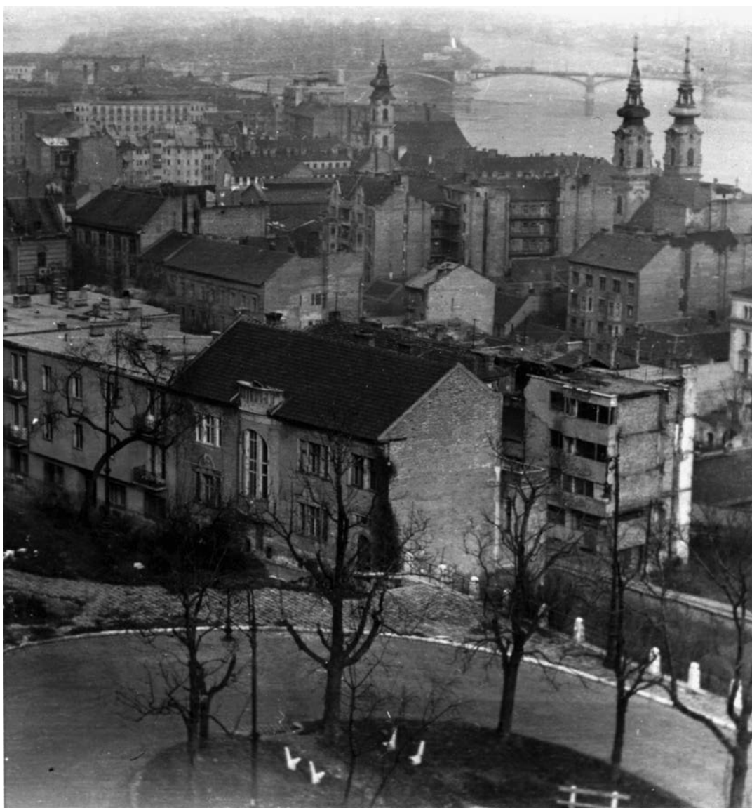
Budapest. Kilátás a Halászbástyáról a Víziváros felé. Előtérben a Hunyadi János úti hajtúkanyar, jobbra a Batthyány téren a Szent Anna-templom. (1950)