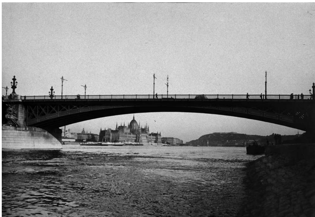
Budapest. Margit hid és a Parlament a budai alsó rakpartról nézve. Távolban a Gellért-hegy. (1900)