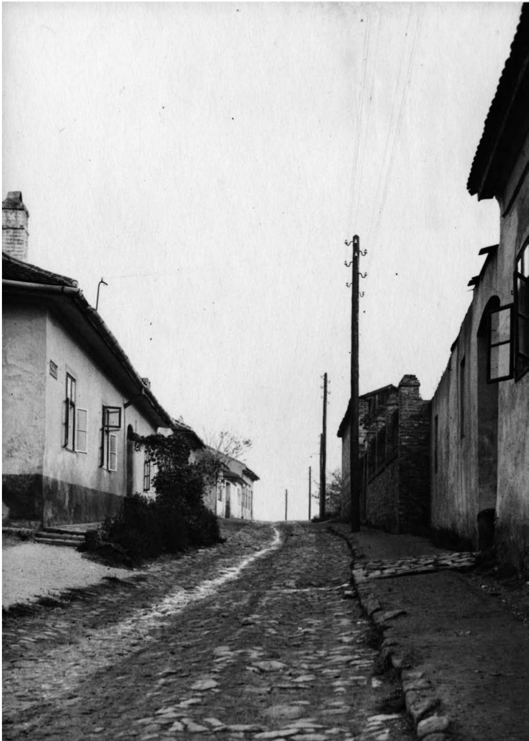
Budapest. Felsőhegy utca. (1926)