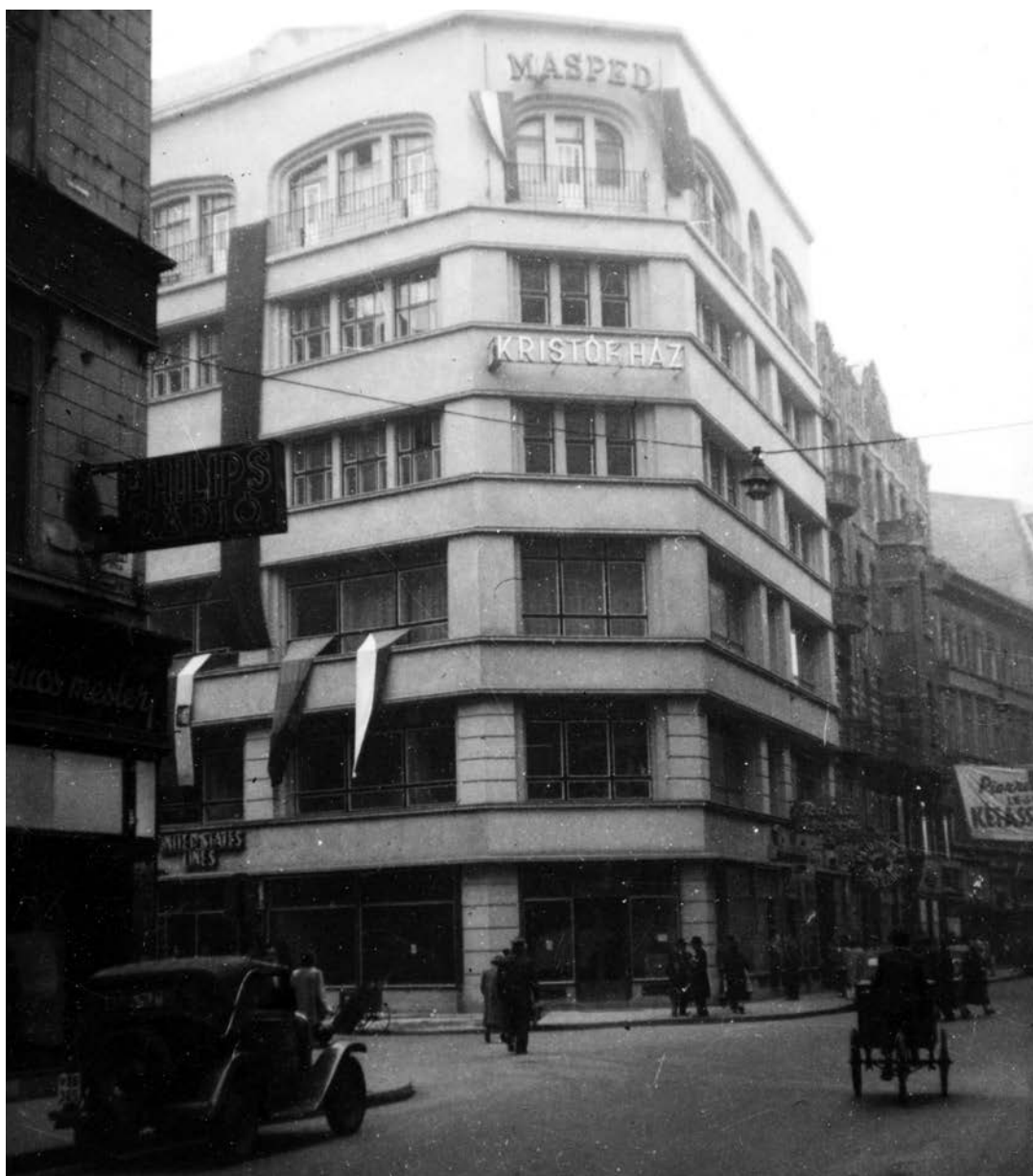
Váci utca, szemben a 6-os számú épület, a Kristóf tér sarkán, a Kristóf-ház. (1948)